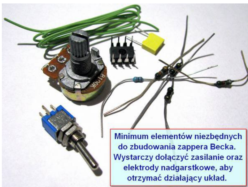
Ilustracja 1: Minimum elementów do skonstruowania Czyściciela Krwi

Aby pokazać, że podstawowa wersja zappera Becka to naprawdę bardzo prosta w realizacji konstrukcja, poniżej zamieszczam fotografię składających się na nią elementów.