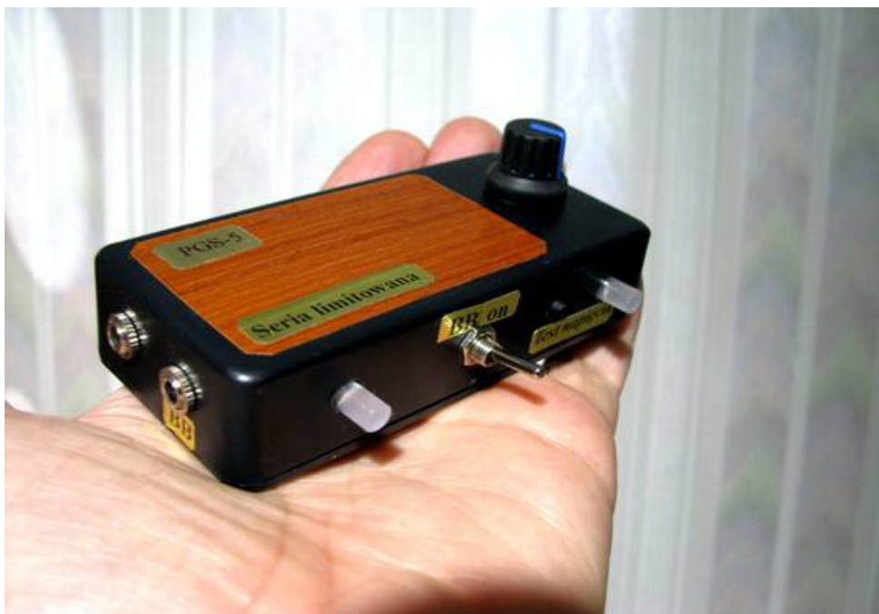
Ilustracja 6: Przykładowe wykonanie BB-SK, to egzemplarz zaprezentowany na filmie.