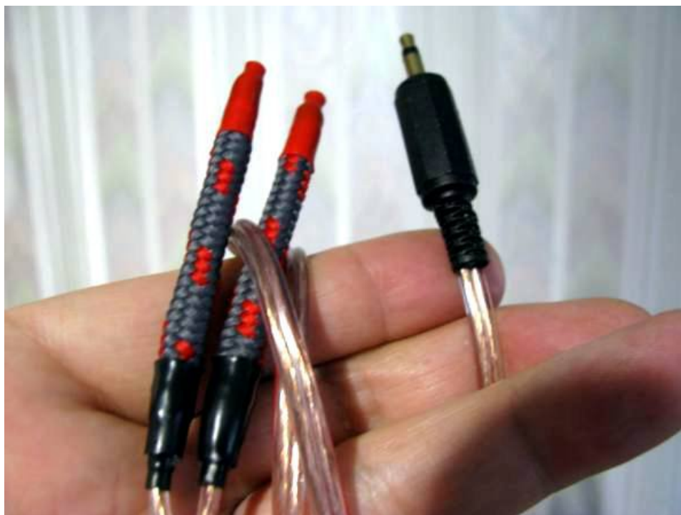
Ilustracja 5: Gotowe elektrody nadgarstkowe do zappera BB.