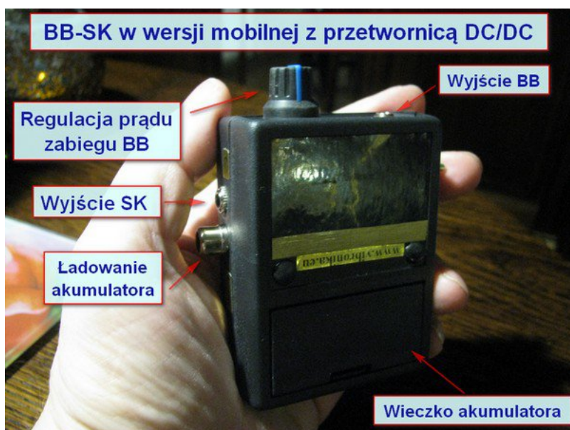
Ilustracja 2: Urządzenie BB-SK w wersji z wbudowanym akumulatorem.